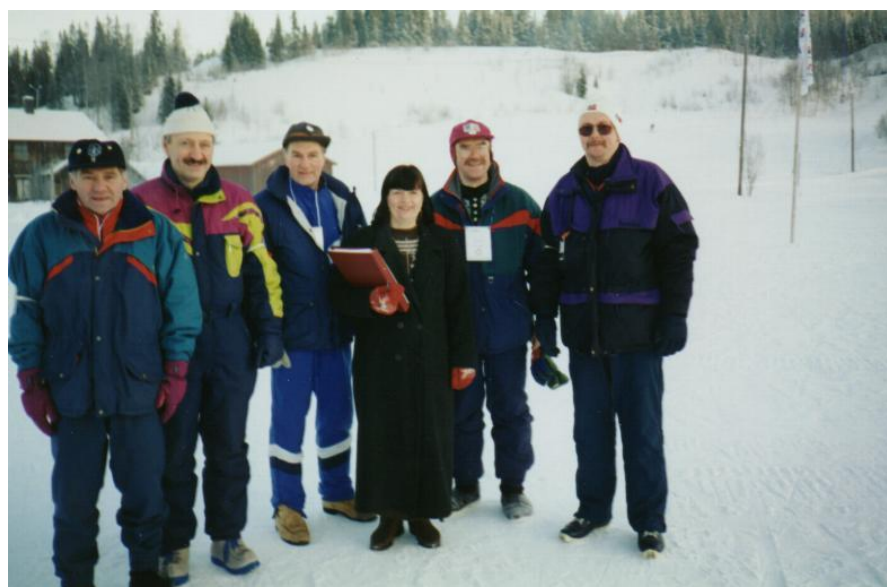
Bilde av komiteen