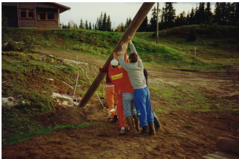
Under arbeidet med lysløypa på Skonseng.

I 1977 / 78 ble det laget et fritids senter i kjelleren på samfunnshuset. Der ble det drevet med forskjellige fritids sysler som bordtennis og biljard, akkurat som det drives med i dag. Frem til i dag har fritids senteret gått både opp og ned akkurat som resten av laget. Den har vært preget av gode og dårlige ledere, men den har greid seg tålelig godt den tiden den har vært til.