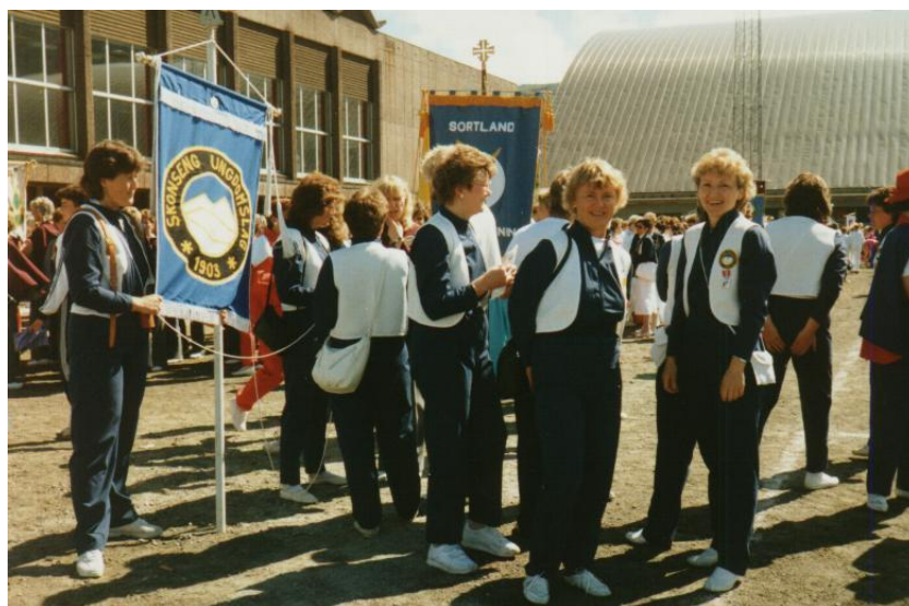
Bilde av turn gruppa.

Samme år ble det for første gang dannet en "optimist-gruppe" som ble tatt ut etter et test løp som sommeridretts gruppa arrangerte for å være med i det populære løpet Optimisten arrangert av Stålkameratene.