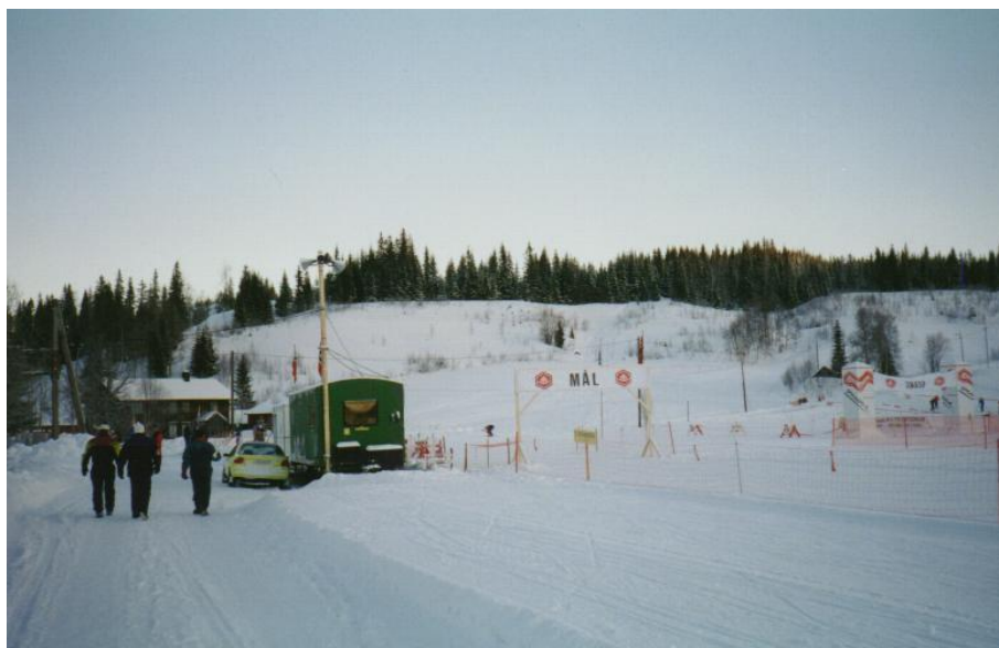
Bilde av stadion

arrangementet. Etter det første rennet hadde de bare fått positive tilbakemeldinger, til tross for at alt som lå i arrangørens hender gikk knirkefritt vil hele rennet bli husket for det rennet som ble avlyst. Vi må rette en stor takk til de som var med å donet og laget til det rennet som ble avviklet.