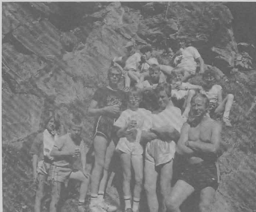
Her er de staute skiløpere forevige på en av sine utflukter i Junkerdalen.