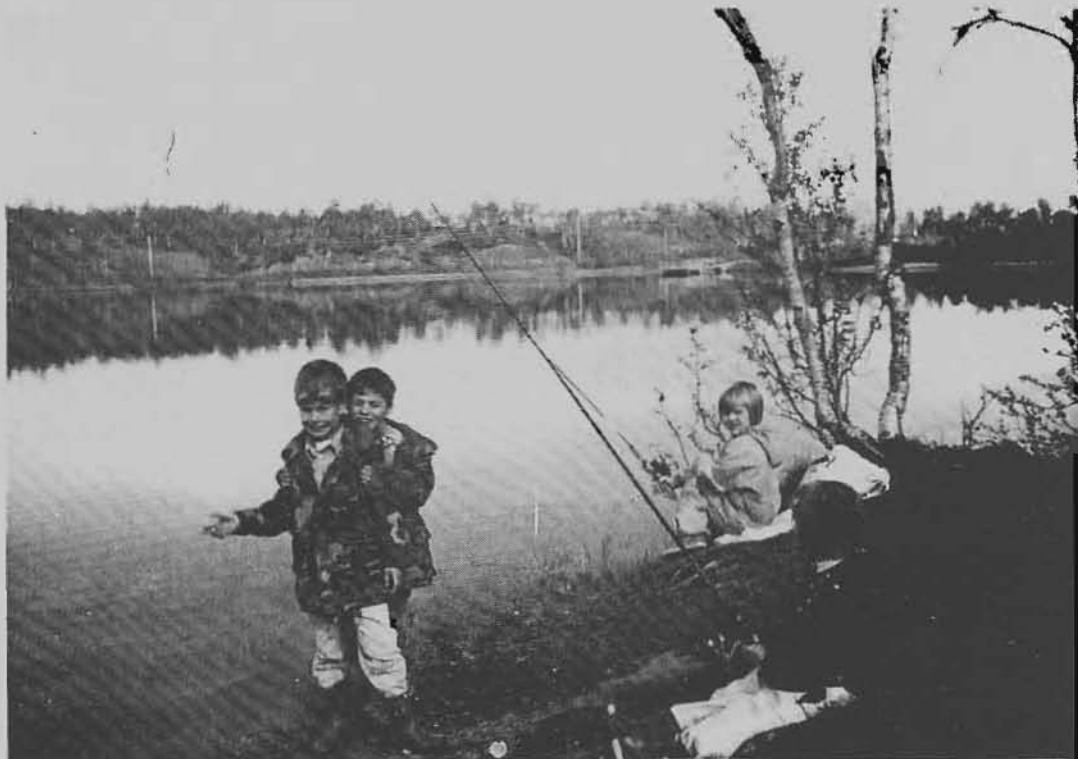
Ivrige fiskere, men fiskelykken sto oss ikke bi