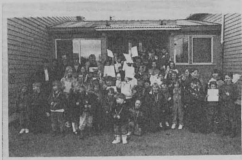
BILDE AV PREMIEUTDELING