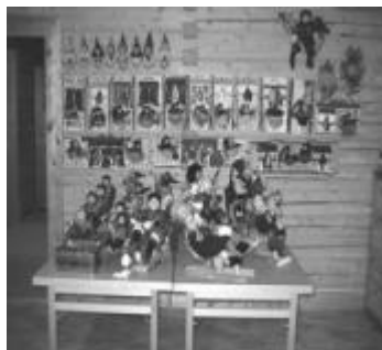
Dette er fra Solfrid og Geir Stormo sin stand.

Det ser ut som dette kommer til å bli en årlig tradisjon. Messa ble en heidundrene fest for alle parter. Det var ca. 280 besøkende.