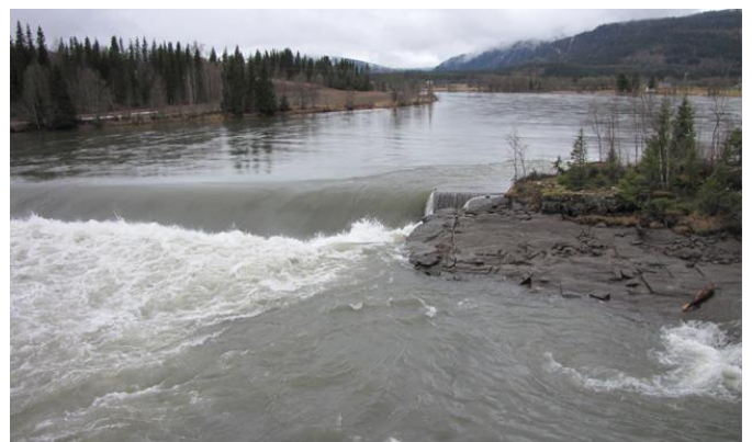
Terskelen ovenfor damlukene som skaper en innsnevring i vannløpet

Skonseng og Røssvoll Bøgdalag (SORB) generelle formål er å fremme samarbeid og utvikling i bøgda. Vi er enn upolitisk organisasjon som er et bindeledd mellom lokalmiljøet og det offentlige i saker som angår bøgda. Laget har representanter fra alle lag/foreninger/institusjoner i bøgda og har også engasjerte privatpersoner og medlemmer fra næringslivet i området. Vårt geografiske område representerer Langvatn-reguleringen godt med utstrekning fra Illhullia til Jamtlia